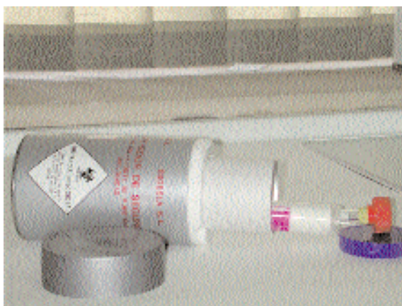
Figura 17.4. Sistema de embalaje para transporte terrestre de material biológico.

relacionados con el tema, como los de la Unión Postal Universal (UPU), la Organización Internacional de Aviación (OIA) y la Asociación Internacional de Transporte Aéreo (IATA).