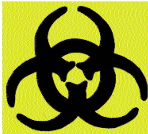
Figura 17.1. Señal de peligro biológico.